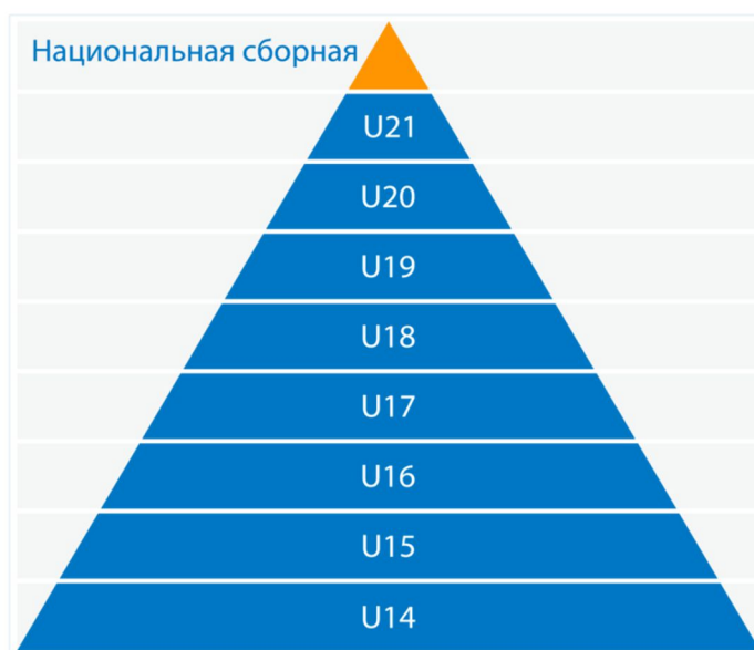
Рисунок №1. Правильная пирамида сборных команд России

Определим правильную пирамиду сборных команд как взаимную и иерархически подчиненную модель (структуру) сборных юношеских и молодежных команд (а также сборную национальную команду, стоящую особняком), которые связаны между собой по возрастному показателю, соответствующего году создания сборной команды, снизу вверх и сверху вниз.